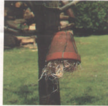
Ein Blumentopf dient als Behausung für den Ohrwurm. (Bild 19)